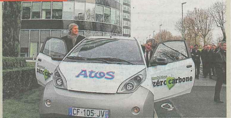
Bezons (Val-d'Oise), hier matin. Thierry Breton (à gauche), PDG d'Atos, et Vincent Bolloré, PDG de Bolloré, lancent la flotte de véhicules 100 % électriques MyCar.